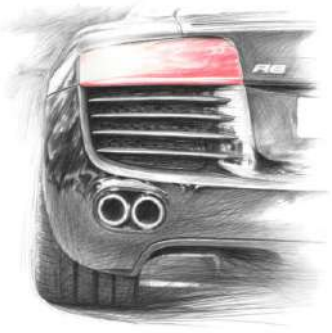
Michel Z Lecomte R8 Crayon 50 x 50 Collection Annick Lecomte