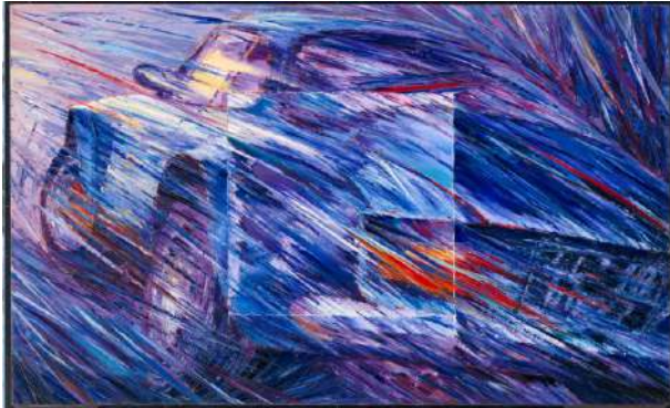
Michel Z Lecomte Berlinette Huile sur toile 89 x 146 Collection Matmut