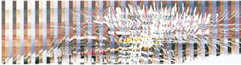
Michel Z Lecomte Portrait d'Ayrton Senna Crayon 45 x 45 Collection Annick Lecomte