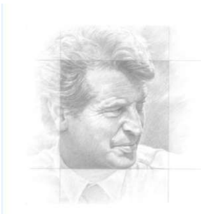
Michel Z Lecomte Portrait de Jean Rédélé Crayon 45 x 45 Collection Annick Lecomte