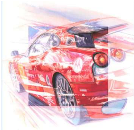
Michel Z Lecomte Ferrari Crayon 90 x 73 Collection Annick Lecomte