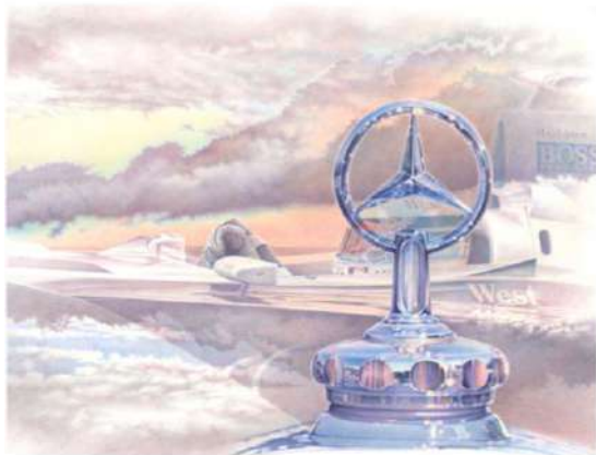
Michel Z Lecomte L'étoile du Nord Crayon de couleur 73 x 90 Collection Annick Lecomte