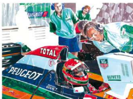
Michel Z Lecomte Stand 1 Encre 90 x 73 Collection Annick Lecomte