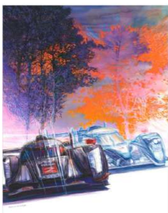
Michel Z Lecomte Dernier projet pour l'affiche 2012 Encre 90 x 73 Collection Annick Lecomte