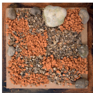
❶ Peinture Nathalie Leroy Fiévée - 2015

Cette peinture est une allusion au parc, Nathalie Leroy Fiévée a souhaité jouer avec l'espace d'exposition et « faire entrer » le parc dans le château.