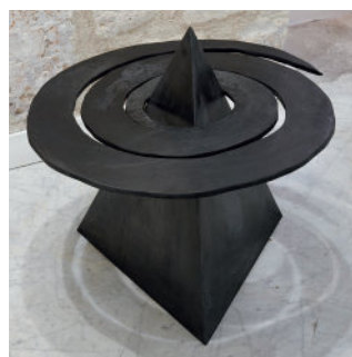
❸ Sans titre Vladimir Skoda - 1983