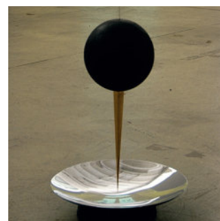
❹ « h » Constante de Planck I Vladimir Skoda - 2004