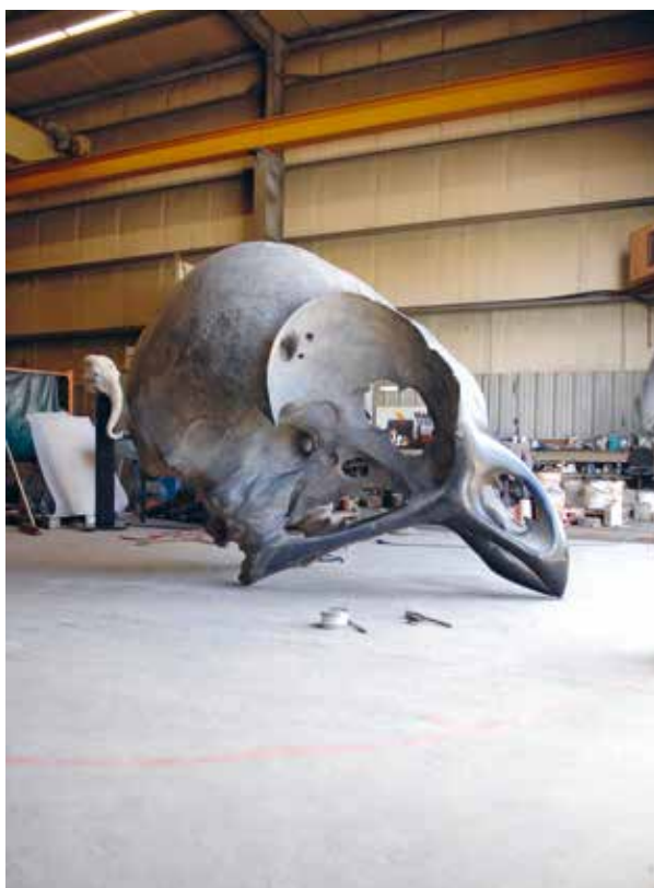
Megalornithos, 2013 Dinanderie laiton 250 x 350 x 200 cm © Quentin Garel