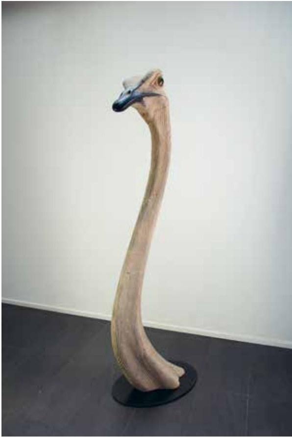
Atruche V , 2017 Bois polychrome et plexiglas 176 x 50 x 40 cm © Quentin Garel