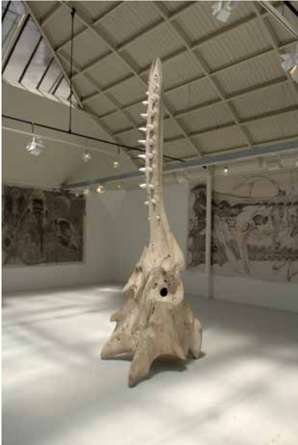
Vue de l'exposition « Monumentalis », mai 2018 © Quentin Garel