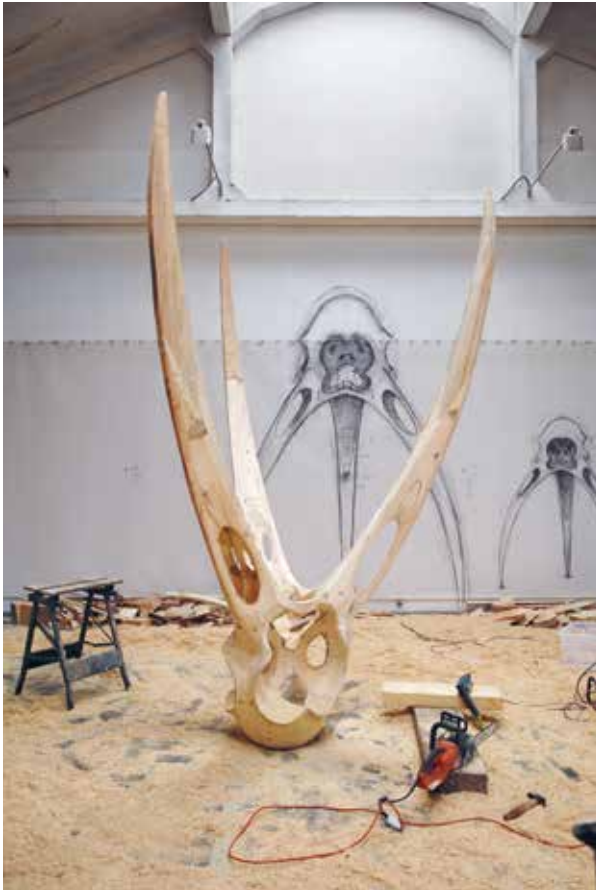
Monozygote II, en cours de réalisation Douville-sur-Andelle, décembre 2016