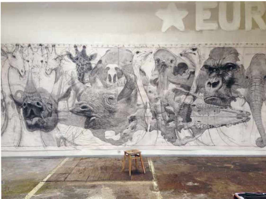
Palimpseste (détail), 2015 Fusain et craie sur papier 272 x 1100 cm © Quentin Garel