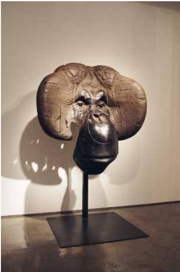
Masque d'orang-outan IV , 2014 Bois polychrome et plexiglas 220 x 110 x 140 cm © Quentin Garel