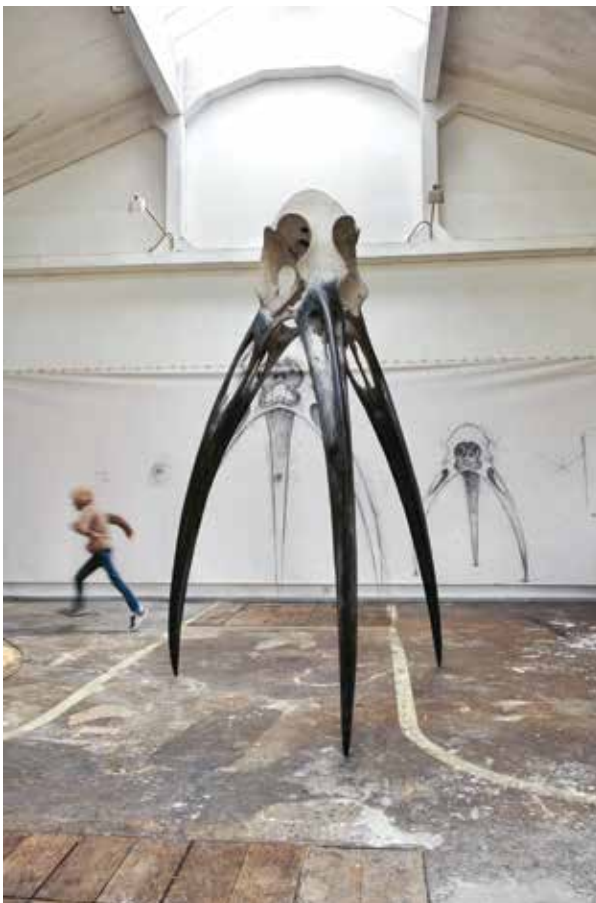
Monozygotes, 2017 Bois polychromes 350 x 260 x 260 cm © Quentin Garel