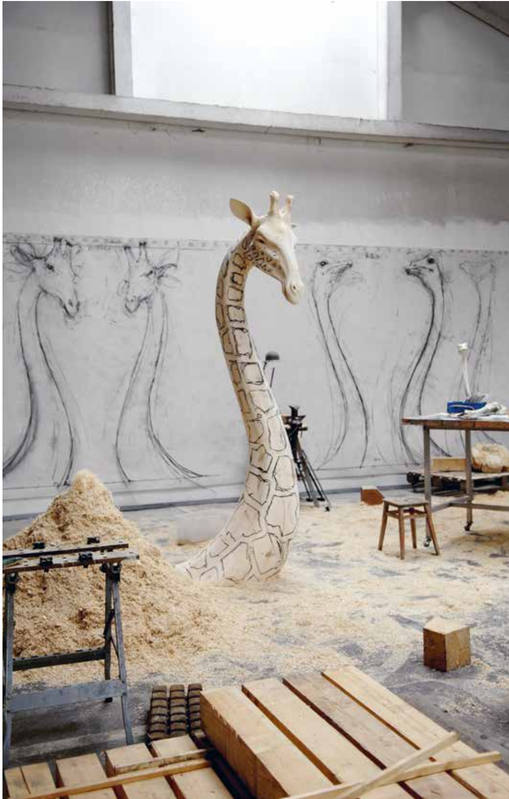
Girafe II , 2014 Bois 278 x 131 x 65 cm © Quentin Garel