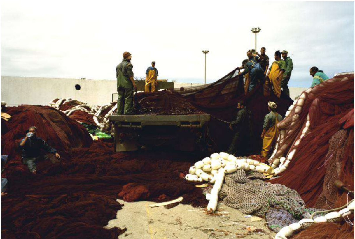
Série Toucher Terre Sud, 2005-2012