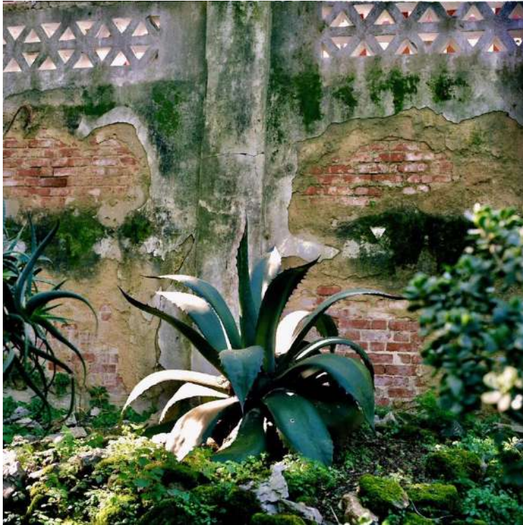
Série Toucher Terre Sud , 2011 © F. Chevallier © Adagp, Paris 2018