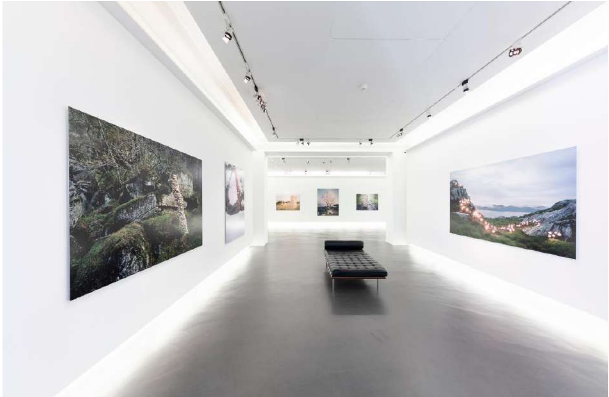
Exposition de Rune Guneriussen, été 2018

Libre d'accès et ouvert à tous, petits et grands, amateurs ou connaisseurs... Le Centre d'Art Contemporain est un lieu dédié aux expositions temporaires d'artistes émergents et confirmés.