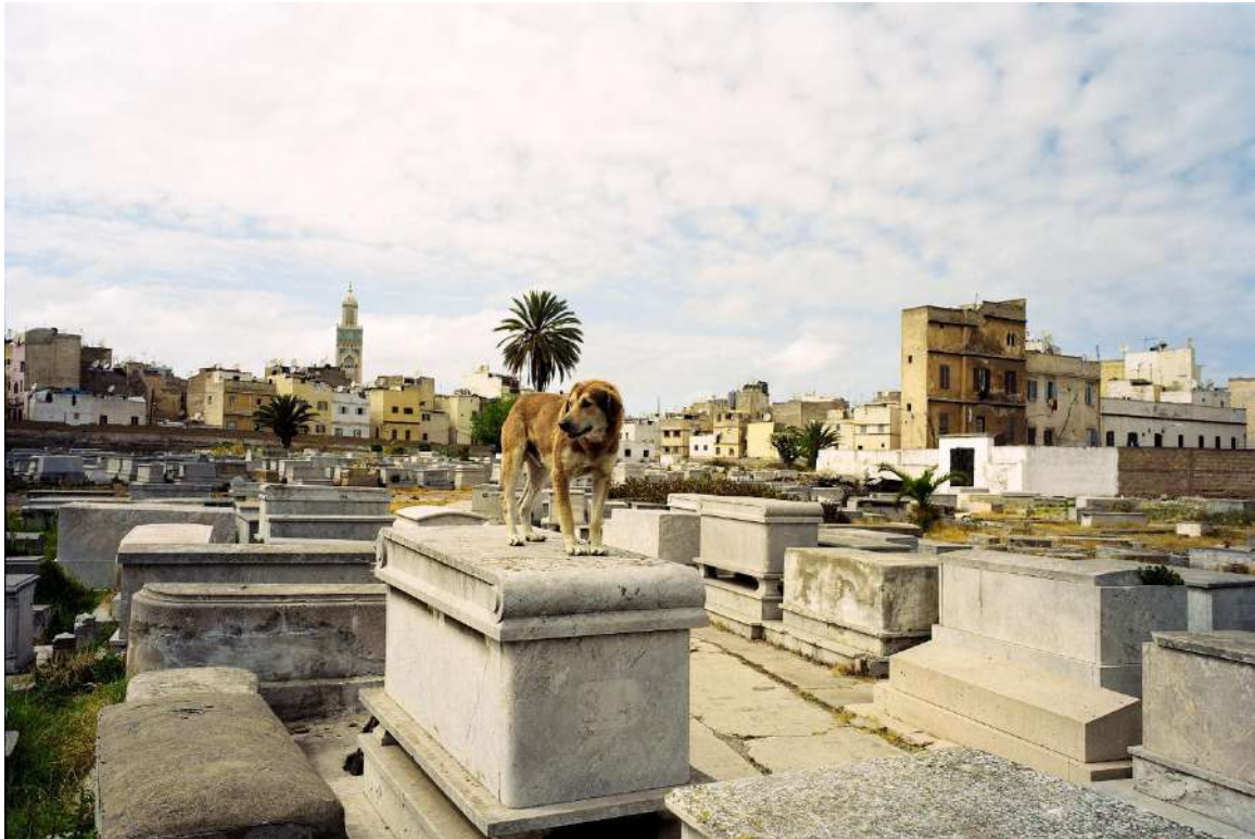
Série Toucher Terre Sud, 2012-2012