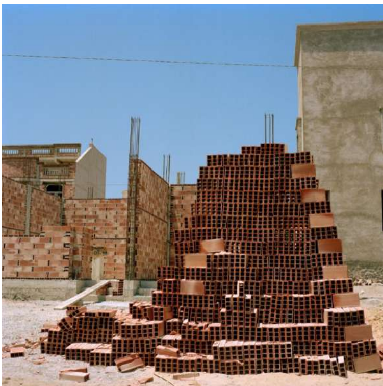
Série Toucher Terre Sud, 2005-2012