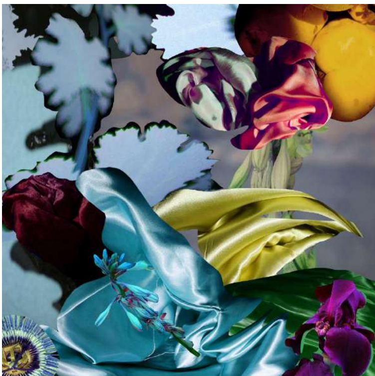
Série Les Plaisirs, 2016-2018