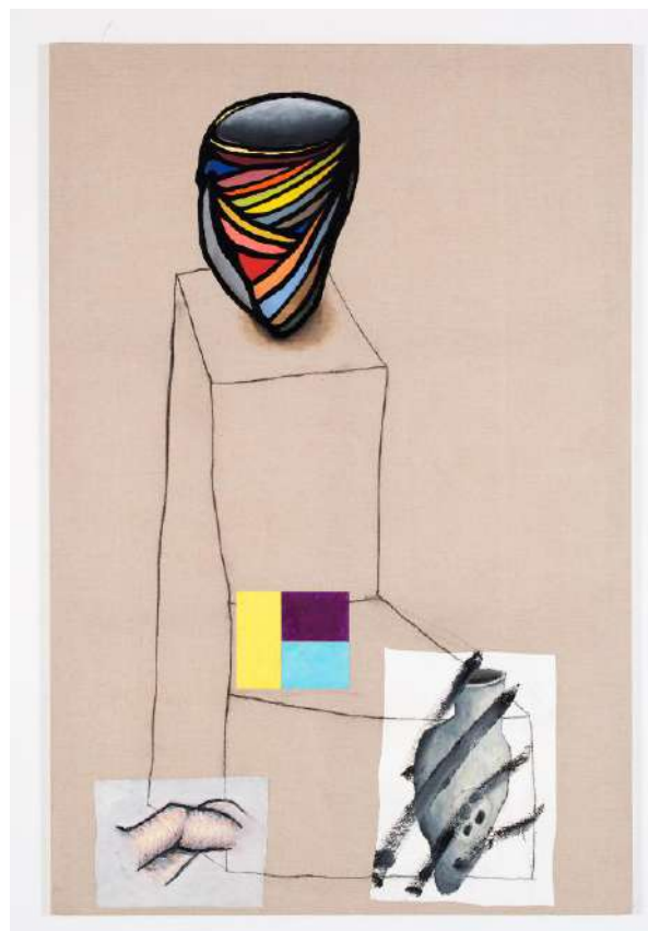
Ratures , 2015 Acrylique, huile, collages sur toile écriue, 195 × 300 cm © C.Bonnefoi © Adagp, Paris 2018