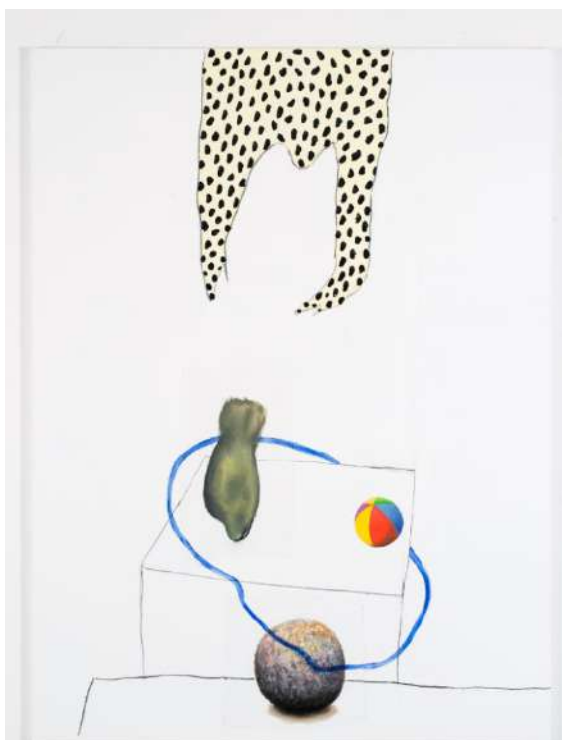
Tableau policier VII , 2012 Acrylique, huile, collages sur toile, 200 × 150 cm © C.Bonnefoi © Adagp, Paris 2018