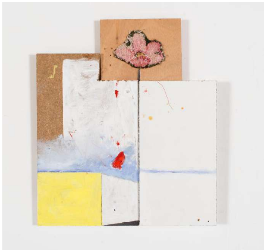
Trompe-l'œil 1 , 2013 Techniques mixtes, bois, 50,5 × 43,5 cm © C. Bonnefoi © Adagp, Paris 2018