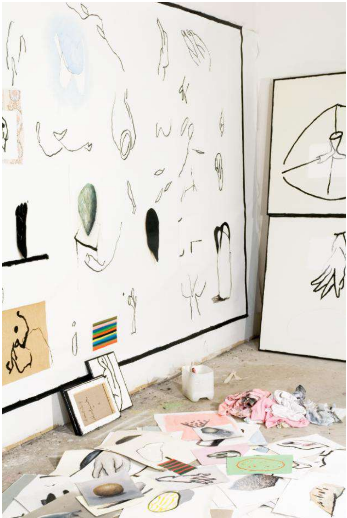
Vue d'atelier