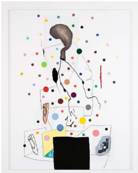
Tableau policier III , 2012 Acrylique, huile sur toile, 200 × 150 cm, © C.Bonnefoi © Adagp, Paris 2018