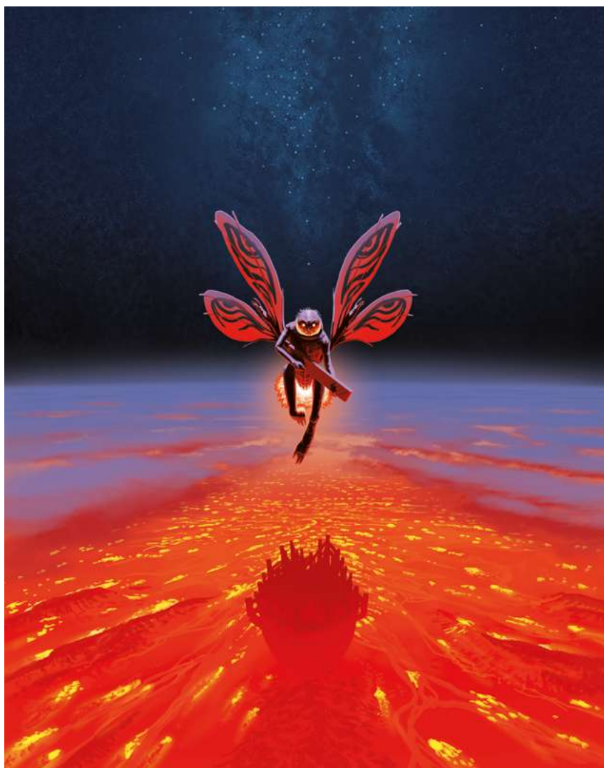
La Forge de Nacärä, F. Duval, F. Blanchard, EMEM – © Éditions Dargaud

dans le futur, et la seconde du space opera , des aventures et des combats dans l'espace. Ces séries se distinguent par leur originalité : dans Renaissance , pour une fois, les extraterrestres n'apparaissent pas comme une menace destinée à anéantir l'humanité, mais bien comme ses sauveurs. Ce renversement de perspective apporte une profondeur nouvelle au récit et invite à réfléchir autrement aux relations entre civilisations. Dans Apogée , qui se déroule 2 000 ans avant la première série, un soldat de la Rome antique se retrouve projeté dans le futur enlevé par les Ouröbörös, civilisation prête à faire la guerre afin de mettre la main sur de nouvelles ressources.