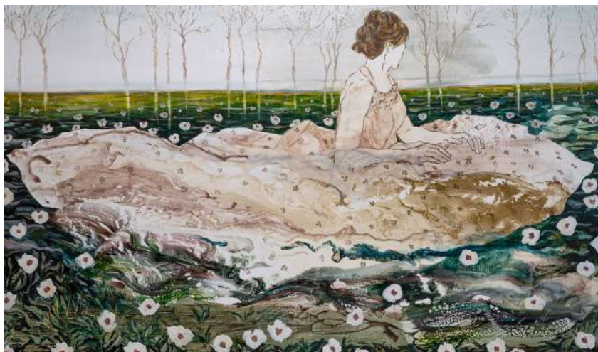
Caroline , technique mixte sur toile, 114 x 195 cm Florence Dussuyer