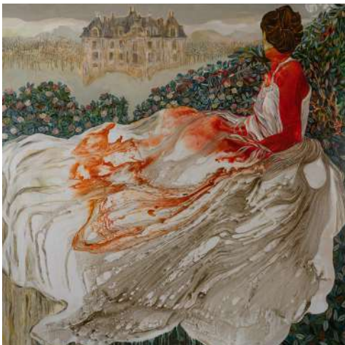
Cendrillon, technique mixte sur toile, 150 x 150 cm Florence Dussuyer