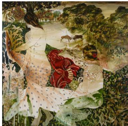
Histoire de femmes 2, technique mixte sur toile, 150 x 150 cm Florence Dussuyer ©Julien Heurtier