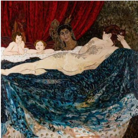
Histoire de femmes 6, technique mixte sur toile, 150 x 150 cm Florence Dussuyer