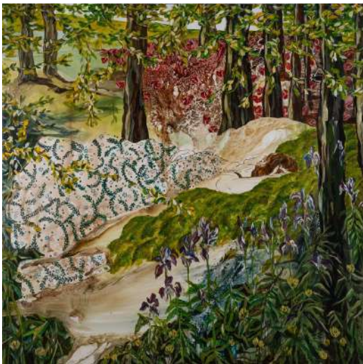
Elles en ont tant rêvé , 2020, technique mixte sur toile, polyptyque, partie 1, 180x180 Florence Dussuyer