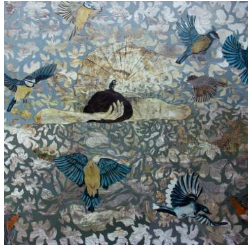
Sulya, technique mixte sur toile, 150 x 150 cm Florence Dussuyer