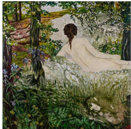
Elles en ont tant rêvé , 2020, technique mixte sur toile, polyptyque, partie 2, 180x180 Florence Dussuyer ©Julien Heurtier