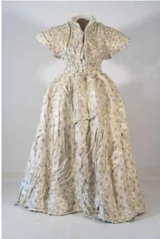
La porter un jour, plâtre, grillage, peinture sur mannequin bois, 140,5 x 78 x 103,5 cm Florence Dussuyer