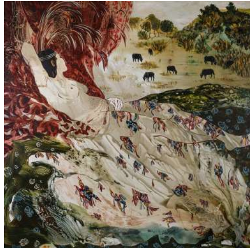
Histoire de femmes 7, technique mixte sur toile, 150 x 150 cm Florence Dussuyer