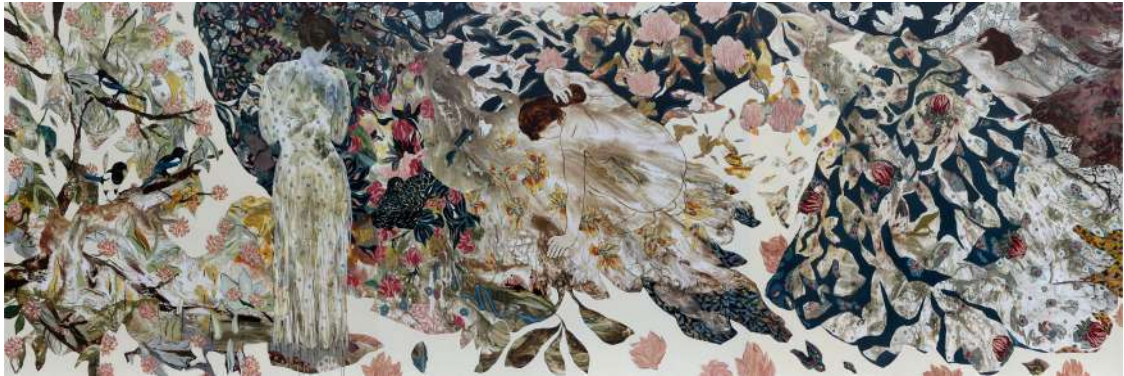
Les matins de Saïgon , technique mixte sur toiles, triptyque, 180 x 540 cm, 2020 Florence Dussuyer