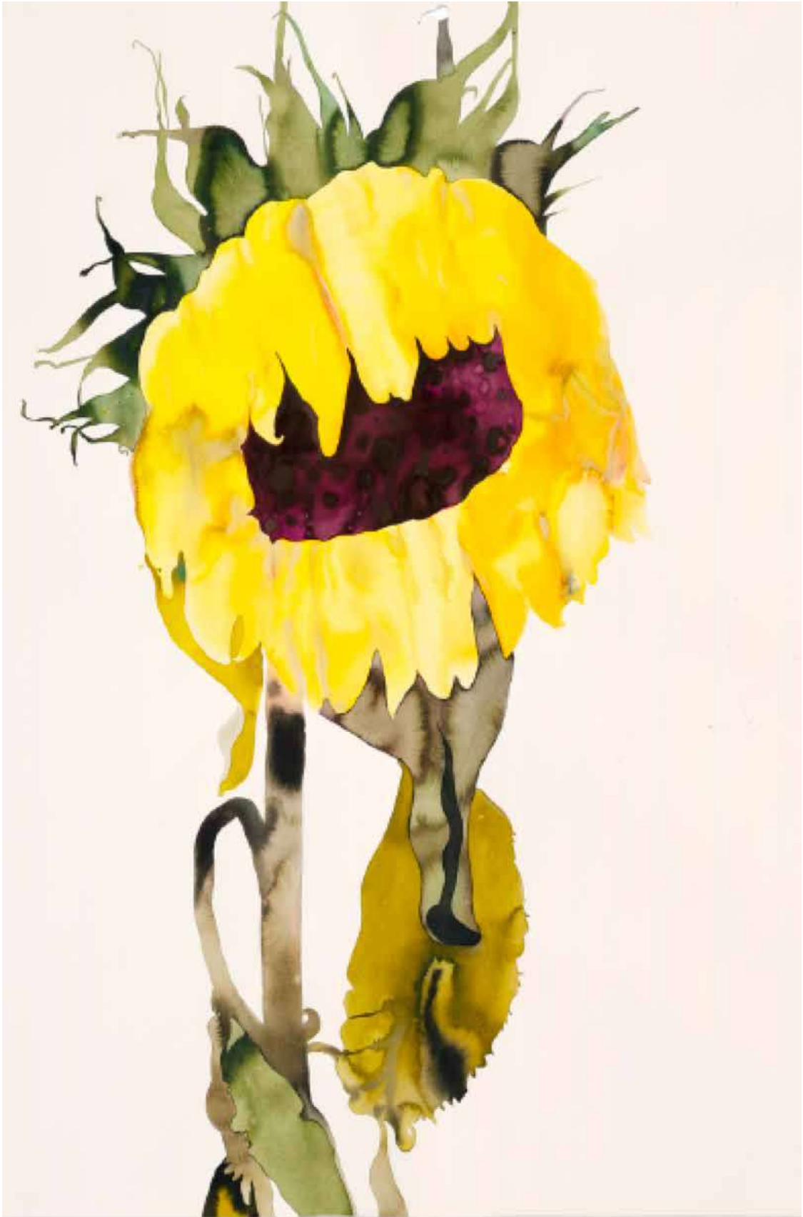
Françoise Pérovitch - Sans titre , 2016 Lavis d'encre sur papier - 160 x 120 cm