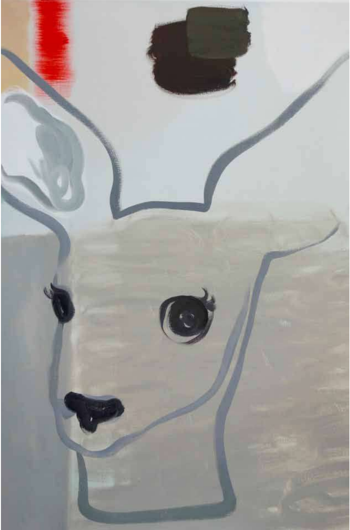
Françoise Pérovitch - Sans titre , 2018 Huile sur toile - 116 x 89 cm