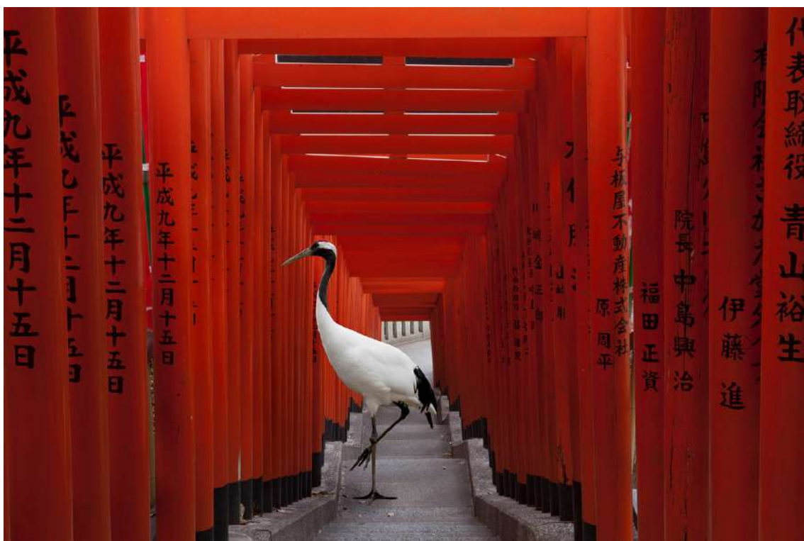
The Journey, Hie Torii, Tokyo, 2015 © Karen Knorr - Courtesy Galerie Les filles du calvaire, Paris.

Avez-vous déjà vu un lion cohabiter avec un paon ? Ou une grue prendre son envol entre les fragiles cloisons de papier d'une architecture japonaise ? Assurément, il y a un truc. Si les magiciens ne révèlent pas leurs tours, Knorr, elle, ne fait pas mystère de sa méthode. Elle construit ses œuvres de A à Z, photographie chaque élément séparément – les lieux vides, d'un côté, les animaux de l'autre. Ensuite, au moyen des logiciels, elle sépare les bêtes de leur environnement et les intègre dans leur nouvel espace. Cette technique, née au 19 e siècle, s'appelle le photomontage.