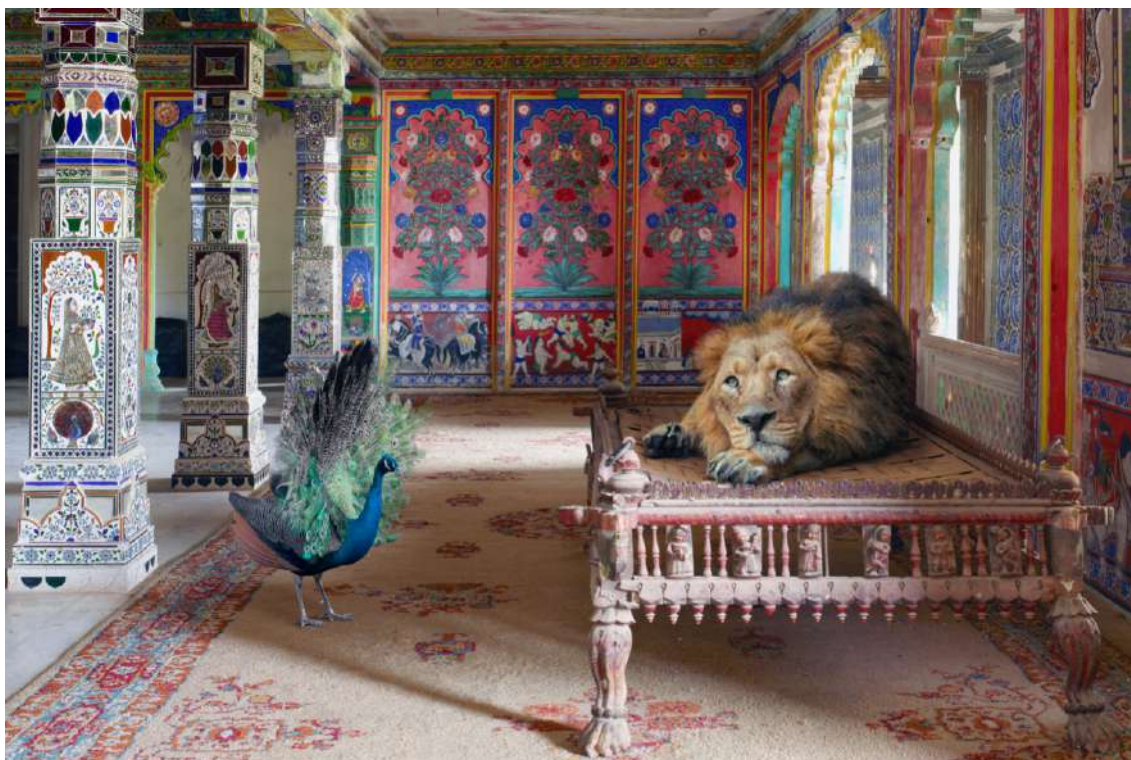
The Lovesick Prince © Karen Knorr - Courtesy Galerie Les filles du calvaire, Paris.

18 e et au 19 e siècle – époque durant laquelle les maharadjahs ont prospéré. Aujourd'hui, ces sites offrent une fenêtre sur le passé, une sorte de capsule temporelle. Les fissures, les fresques qui s'effritent, la peinture qui s'écaille, les ampoules sur les lustres ou la signalétique le rappellent brutalement. Certains lieux subissent le même sort que la faune, ils sont en sursis, menacés par les aléas climatiques ou le surtourisme. D'autres incarnent simplement des normes et une culture construites sur une forme d'exclusivité, voire d'exclusion, bien éloignées des enjeux de notre temps.