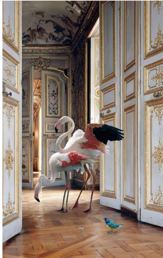
The Grand Monkey Room (2) , (Musée Condé, Chantilly), 2006, Série « Fables »

Ainsi, Knorr s'écarte des écrits de Jean de La Fontaine, voire des peintures qui entourent ce trio à plumes. Ils sont sur le seuil de la Grande Singerie. Cette pièce tire son nom de ses décors mettant en scène une multitude de singes. Vêtus comme les habitants du domaine et leurs proches, ils imitent également leurs gestes et leurs habitudes. Bref, ils se moquent – gentiment – de l'aristocratie.