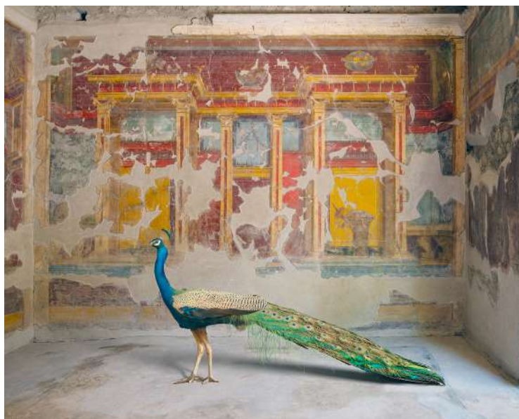
Hera's Eyes, Villa Oplontis

Ces scènes improbables évoquent les fables et les histoires qui plaisent tant à Karen Knorr. Elle leur consacre même plusieurs séries. « Fables » convoque les écrits de Jean de La Fontaine ou d'Ésope. « Scavi » se tourne vers les mythes antiques, « Monogatari » emprunte aux récits bouddhistes et aux histoires du Japon. Quant à « Chanson Indienne », ce travail puise dans le Panchatantra – un recueil de contes indiens très anciens qui a influencé La Fontaine. La boucle est bouclée. Reste que ces récits ne sont qu'un point de départ autour desquels la photographe brode ses propres histoires. Des histoires auxquelles elle donne vie en images, mais aussi à l'écrit dans des textes de son invention.