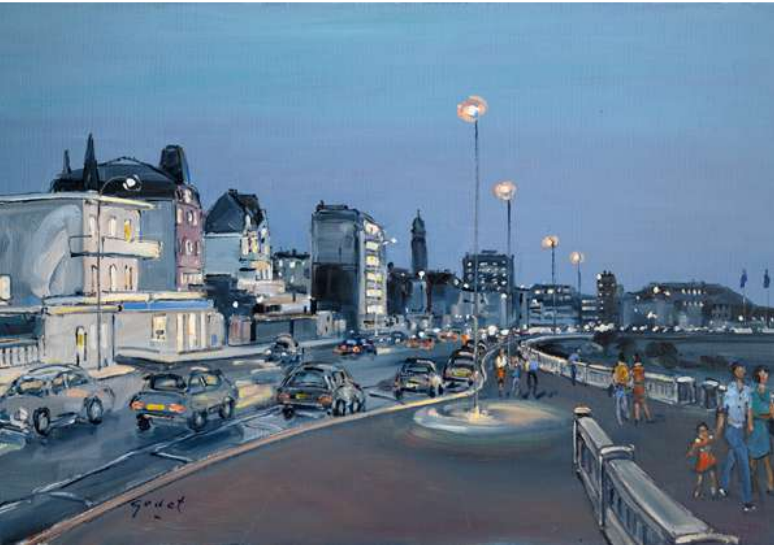
Front de mer - Le Havre 92 x 73 cm - Acrylique sur toile