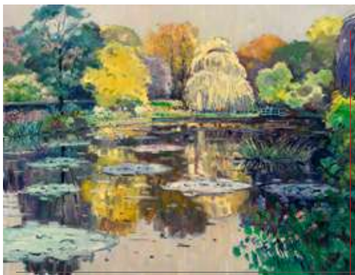
Giverny - 100 x 50 cm - Acrylique sur toile

Cette série Parlement de Londres de Monet est, encore aujourd'hui, l'archive la plus précise et précieuse qui renseigne sur le brouillard de l'époque victorienne.