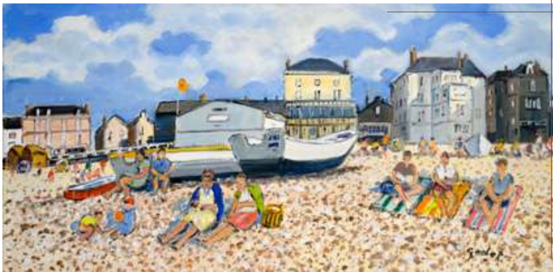
Yport - 100 x 50 cm - Acrylique sur toile

Comme chez Pierre Godet, les sujets de la ville (Raoul Dufy, Maurice de Vlaminck) et les paysages méditerranéens (Derain, Matisse, Camoin) sont des thématiques récurrentes chez les artistes fauves.