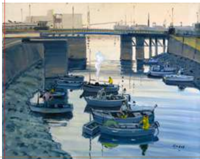
Le Havre, Le port - 92 x 73 cm - Acrylique sur toile

Le Quai du Havre (huile sur toile, 1887), La plage à Trouville (huile sur toile, 1893) d'Eugène Boudin trouvent un écho chez Pierre Godet, avec par exemple Armada - 2019 , ou Fin de jour - Trouville .