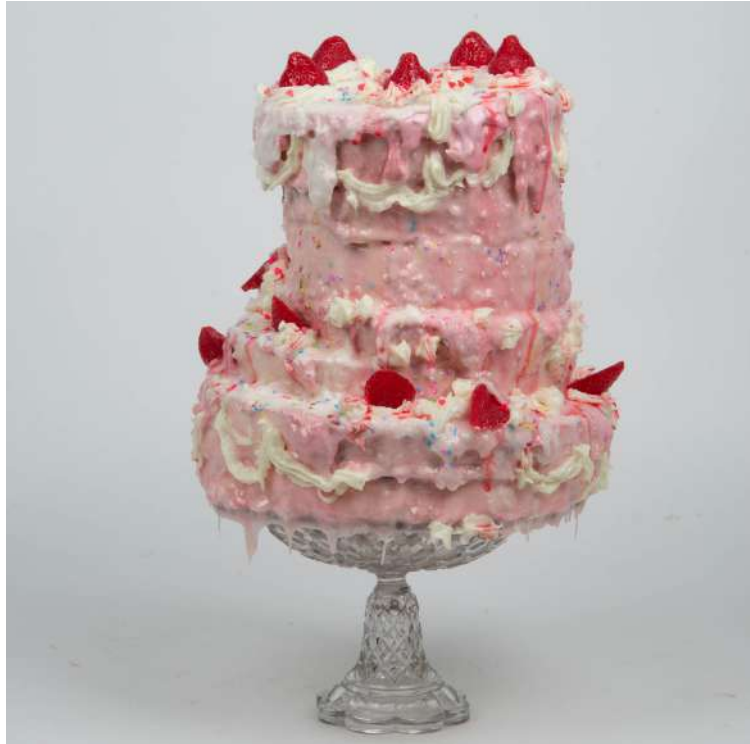
Strawberry Squeezed, 2021 © ADAGP, Paris 2023