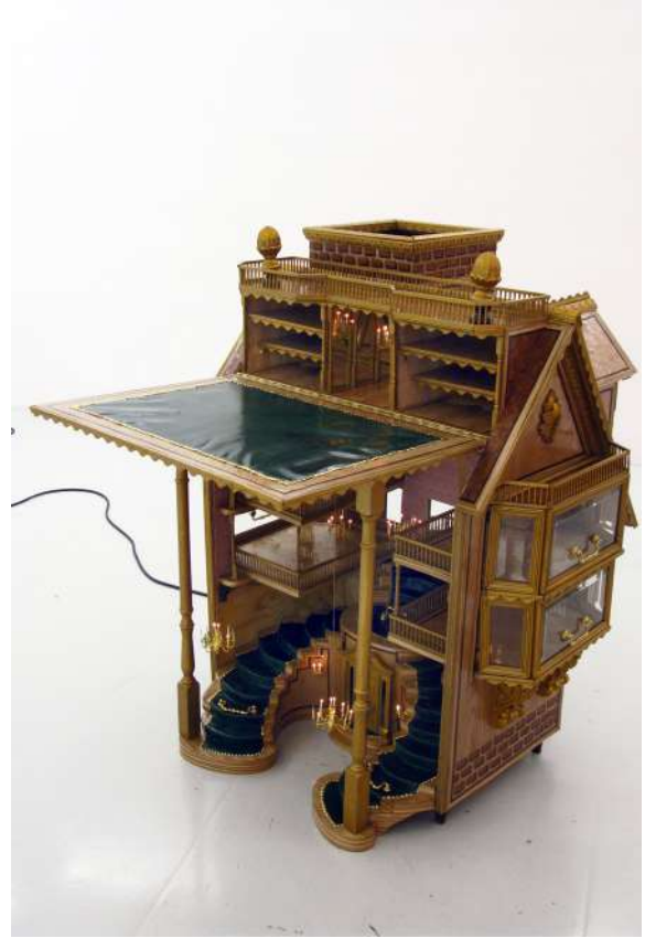
Chute d'un Empire suite et fin © ADAGP, Paris 2023