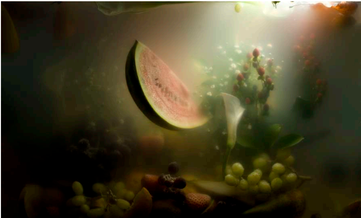
Je ne peux pas faire de miracles III, 2007 © ADAGP, Paris 2023