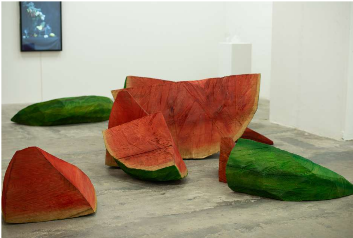
Salade de frais pastèque, 2019 © ADAGP, Paris 2023