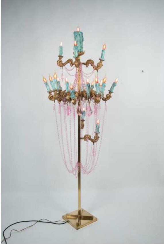
Chandelier vert, 2020 © ADAGP, Paris 2023