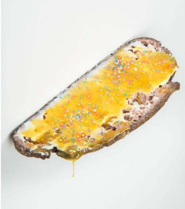
Commensalisme 10746 © ADAGP, Paris 2023