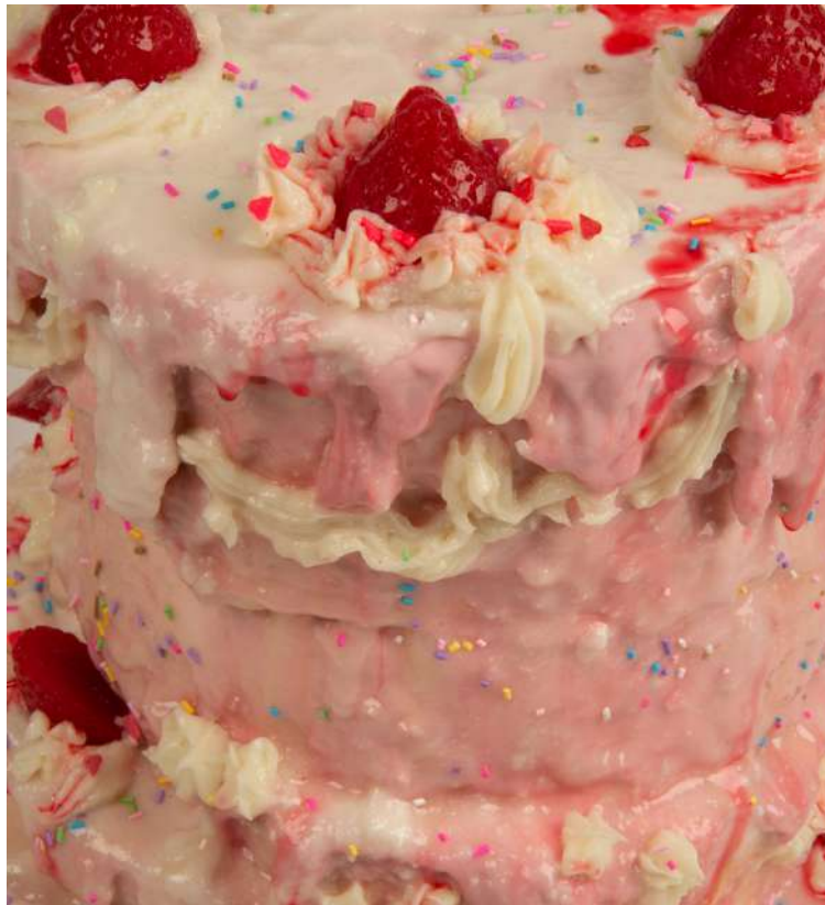
Strawberry Squeezer (détail), 2021 © ADAGP, Paris 2023