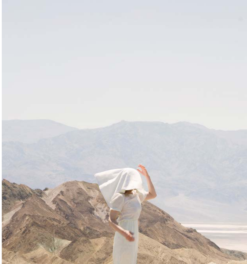
© Maia Flore, Death Valley, 2017