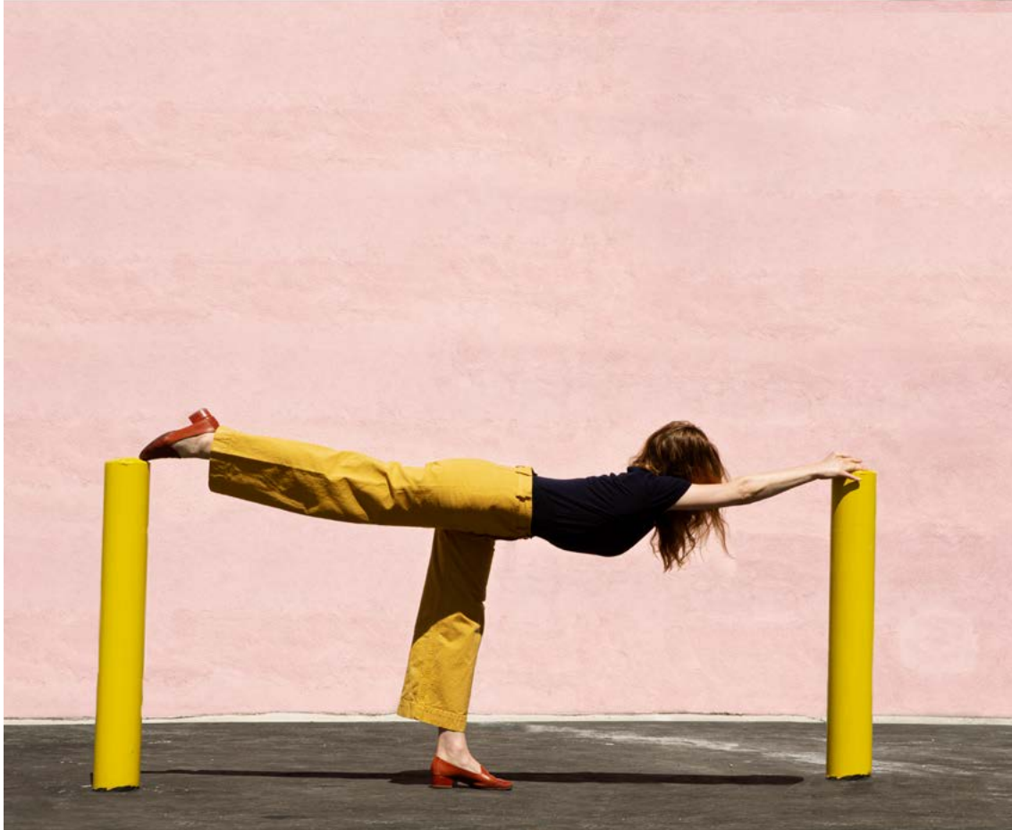
© Maia Flore, How to park in Los Angeles , 2018