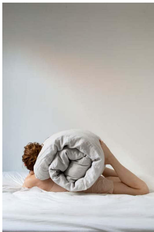
© Maia Flore, Slow Life , 2020

La photographe utilise souvent des éléments qui l'entourent (ses cheveux, des draps ou des nuages) comme des extensions d'elle-même pour faire rire tout en cachant son visage. La photographe semble vouloir ne faire qu'un avec l'environnement qui l'entoure. Dans la photographie How to park in Los Angeles (comment se garer à Los Angeles), Maia Flore se fond dans le décor urbain. Elle s'associe à un poteau jaune, de la même couleur que le pantalon qu'elle porte.