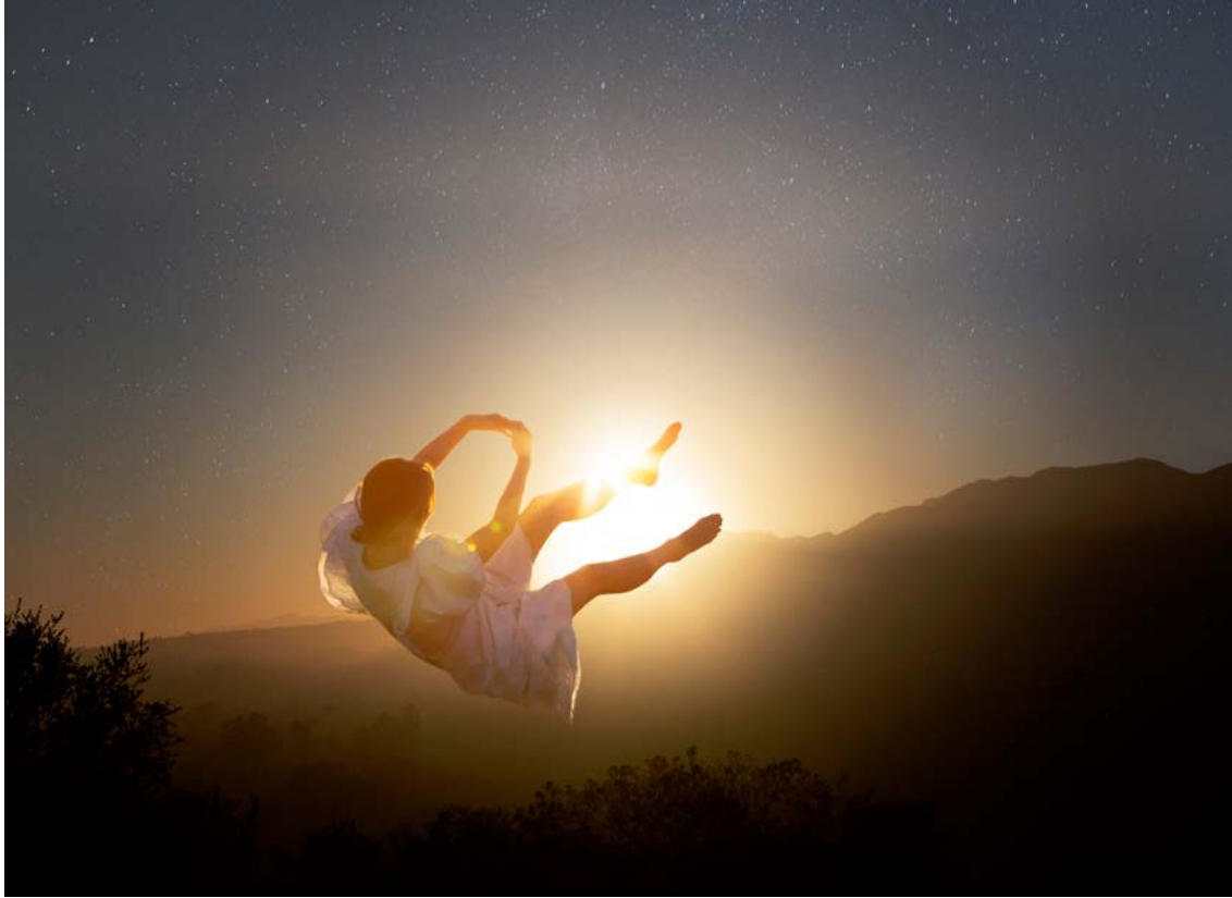
© Maia Flore, Couchée du soleil, 2021