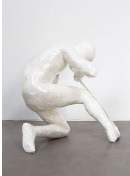
Déconditionnement , 2018 Sacs poubelle, ruban adhésif, mousse polyuréthane