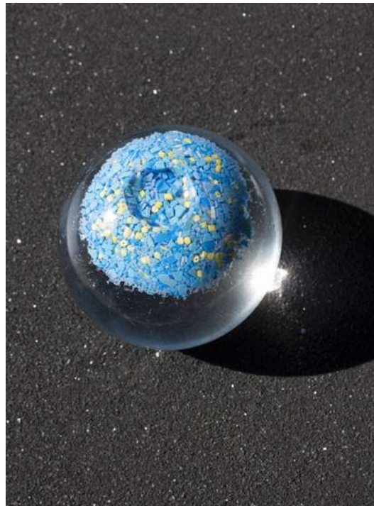
Boule à neige (7 e continent) , 2020 Verre soufflé, résidus de plastique, eau, glycérine, sable, socle en bois