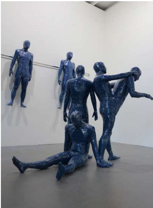
Autoproduction , 2017 Sacs poubelle, ruban adhésif, mousse polyuréthane, présentoirs de magasin