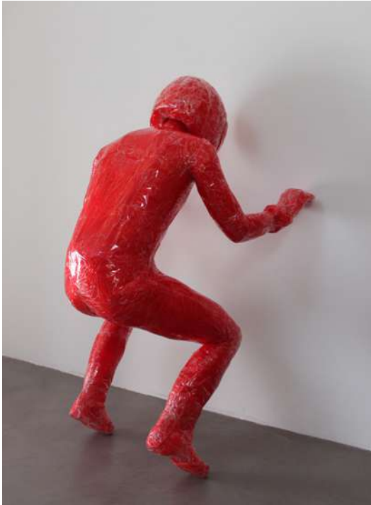
Le sens de la vie : le motard , 2013 Sacs plastique, ruban adhésif, mousse polyuréthane © Courtesy Florent Lamouroux et Galerie Isabelle Gounod, Paris - France