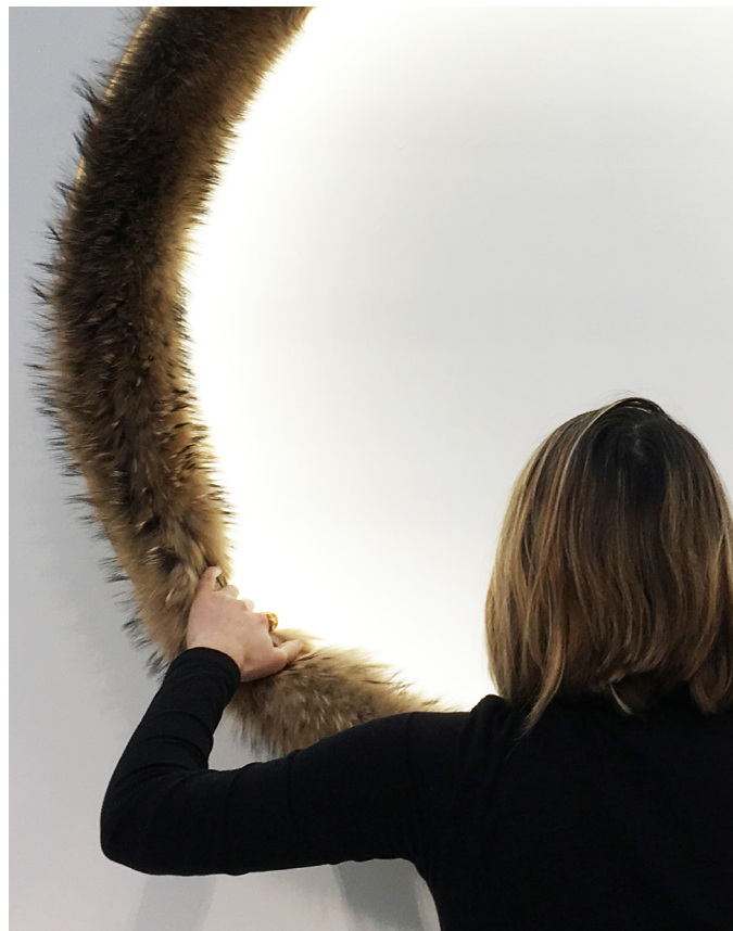
© Bina Baitel, Fur-light , photo Bina Baitel Studio.

Par exemple, certaines pièces peuvent se plier, se dérouler, ou changer d'apparence selon la façon dont on les touche ou les regarde. Avec des objets ludiques, hybrides et poétiques, Bina Baitel transforme notre manière de percevoir ce qui nous entoure.