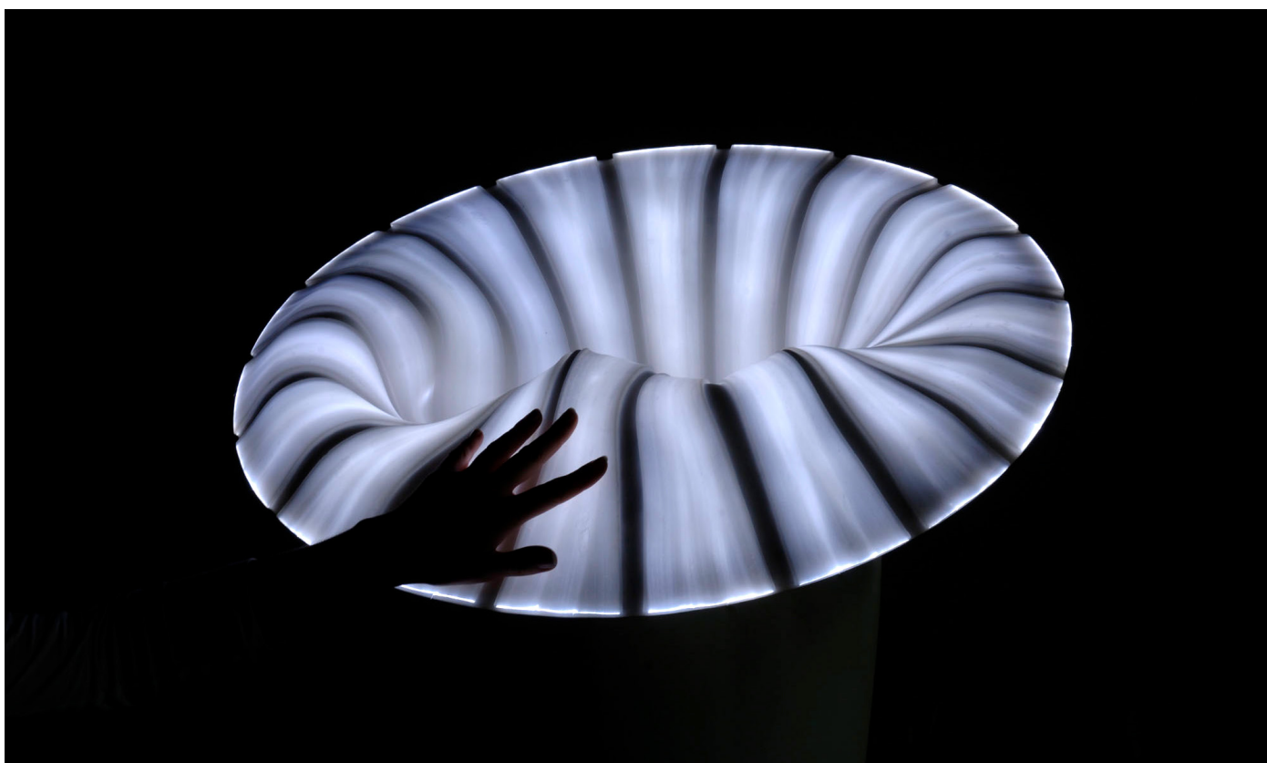
Bina Baitel, Pull Over , VIA-2008.

* Citation tirée de l'entretien réalisé par Ryan Waddoups pour le magazine Surface , 3 octobre 2023.