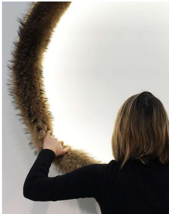
© Bina Baitel, Fur-light , photo Bina Baitel Studio.

Par exemple, certaines pièces peuvent se plier, se dérouler, ou changer d'apparence selon la façon dont on les touche ou les regarde. Avec des objets ludiques, hybrides et poétiques, Bina Baitel transforme notre manière de percevoir ce qui nous entoure.