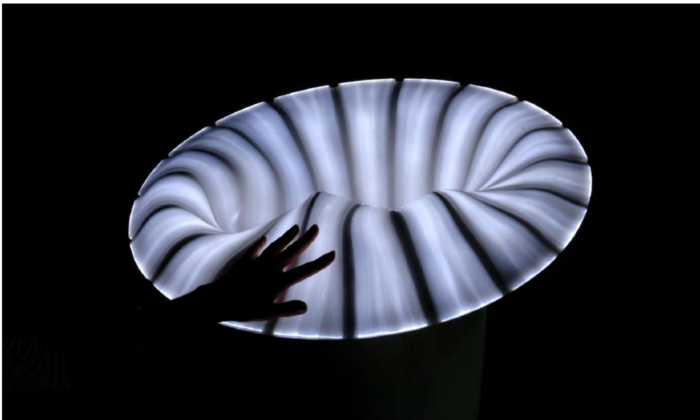
Bina Baitel, Pull Over , VIA-2008 © Marie Flores.

* Citation tirée de l'entretien réalisé par Ryan Waddoups pour le magazine Surface , 3 octobre 2023.