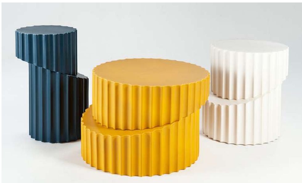
© Bina Baitel, Doric Roche Bobois - Side-table .