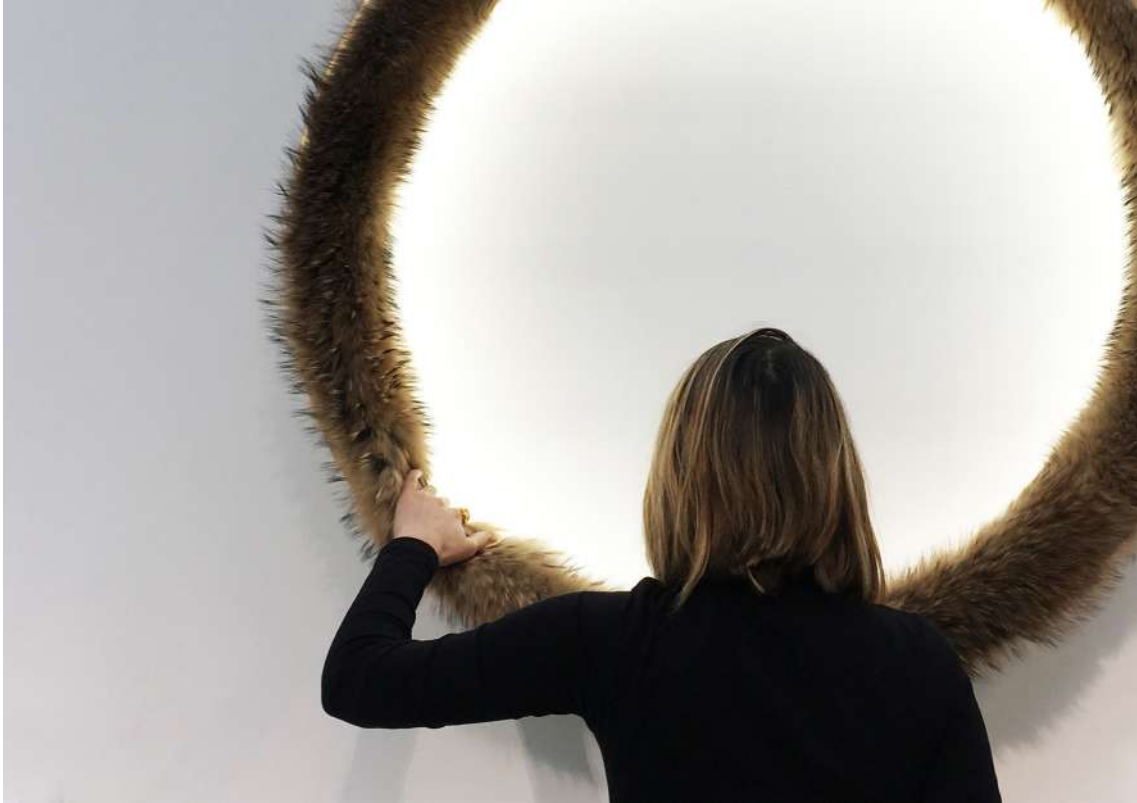
© Bina Baitel, Fur-light , photo Bina Baitel Studio.