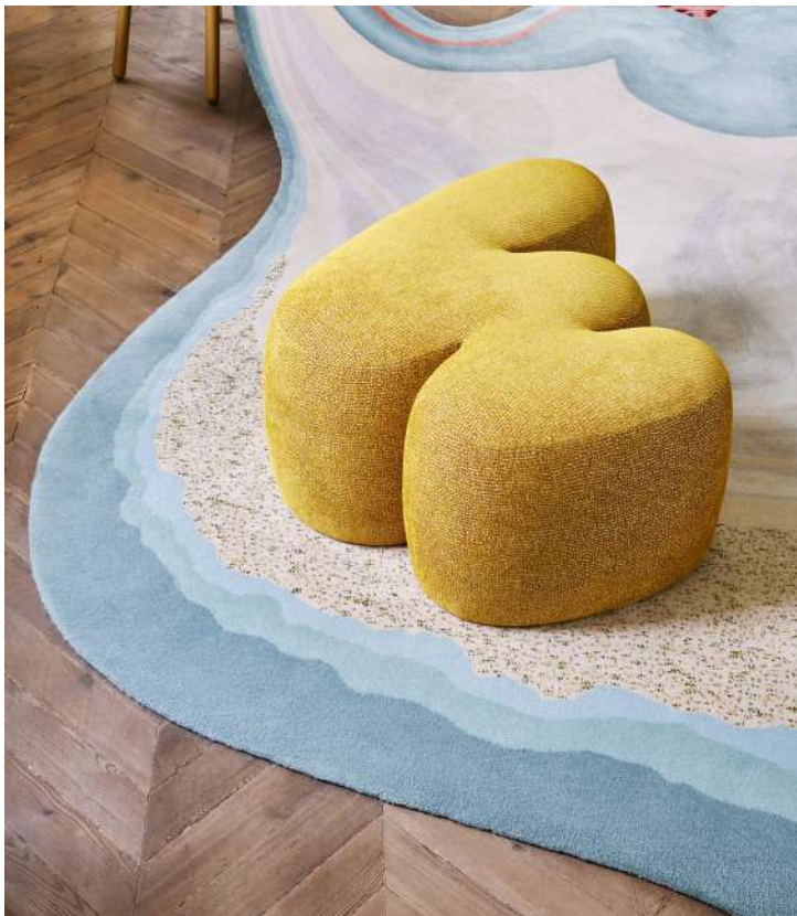
© Bina Baitel, Zigzag Ottoman