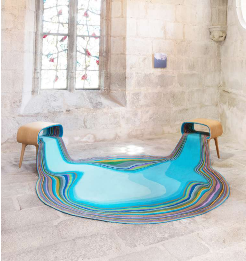
© Bina Baitel, Confluencia Aubusson .