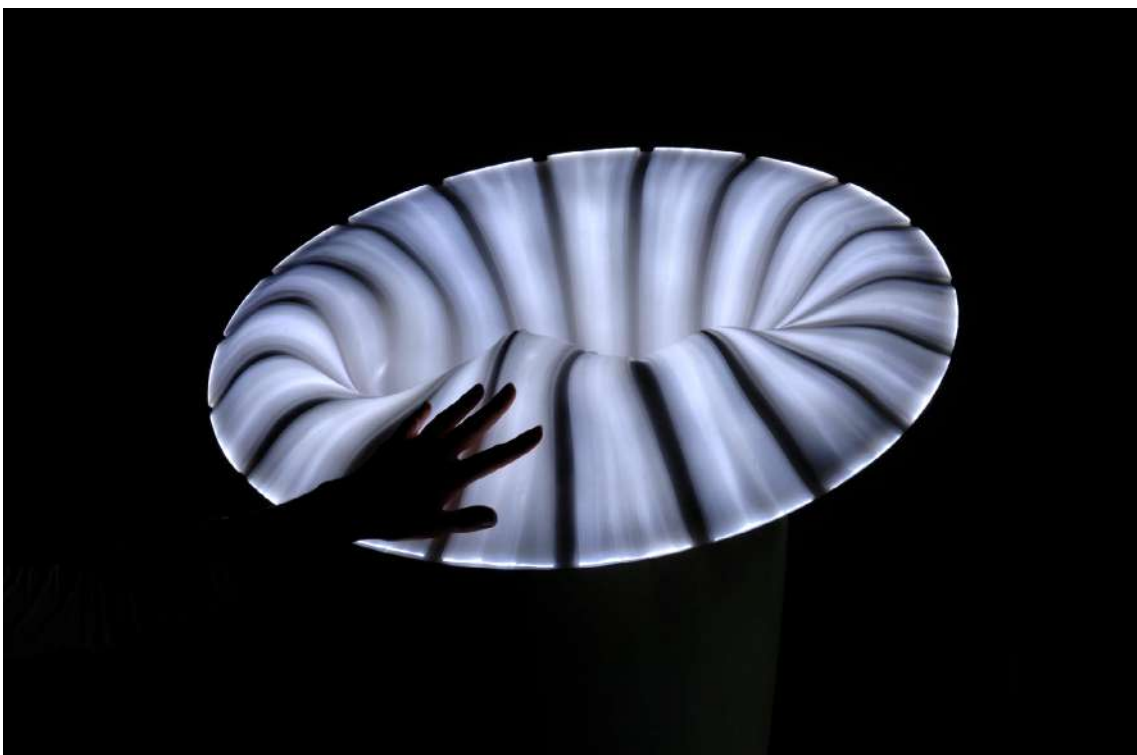
© Bina Baitel, Luminaire Pull-Over , photo : Marie Flores.