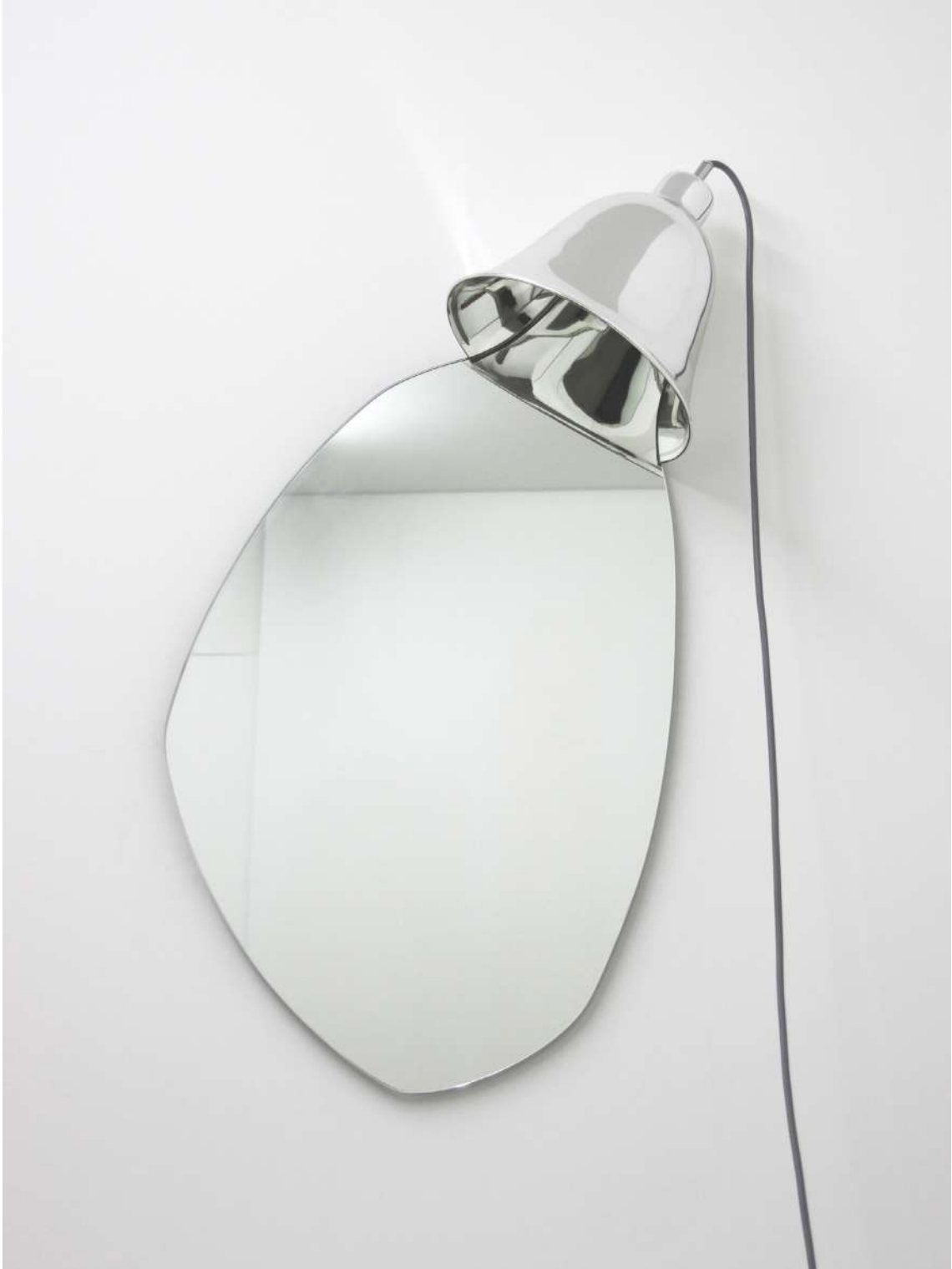
© Bina Baitel, Grimm Lampe Miroir