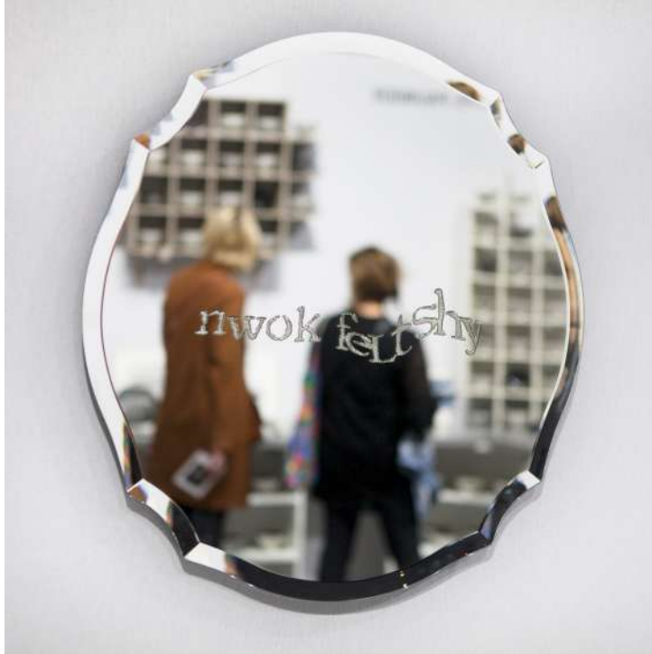
© Bina Baitel, Captcha Mirror , photo Gilad Sasporta.