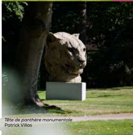
Tête de panthère monumentale Patrick Villas