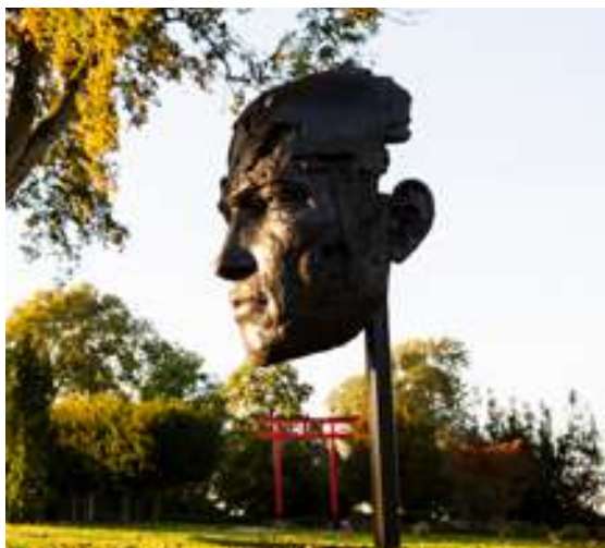
Tête de Persée monumentale Christophe Charbonnel