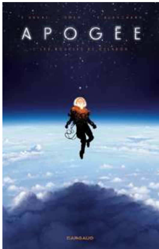
Apogée tome 1 – Les boucles du Celadon

Au travers d'une sélection de planches, maquettes, éléments de décor et la scénographie, le parcours de l'exposition abordera les secrets de fabrication de ces bandes dessinées (inspirations, scénario, storyboard, dessins, encrage, colorisation) en présentant le rôle complémentaire de ces trois acteurs.