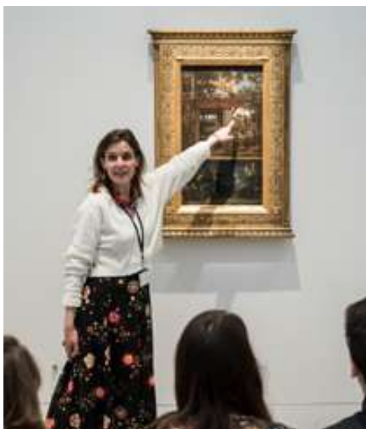
Mondes Souterrains

21 projets autour de l'accessibilité ont ainsi été soutenus en 2025. Ils auront permis le déploiement d'outils de médiation adaptés aux différents publics comme une maquette tactile au Théâtre des Célestins à Lyon, des cartels universels et FALC dans le cadre des expositions du Louvre Lens ou du Grand Palais ou encore des visites en langue des signes française assurées au Consortium Museum de Dijon. Les personnes en situation de handicap sont aussi au cœur du programme d'accessibilité du nouveau mécéné Théâtre du Châtelet tandis que le public incarcéré peut compter sur les spectacles hors les murs