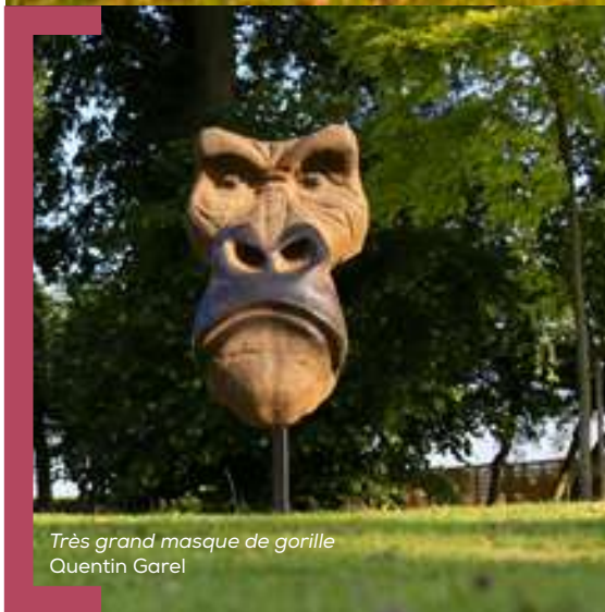
Très grand masque de gorille Quentin Garel