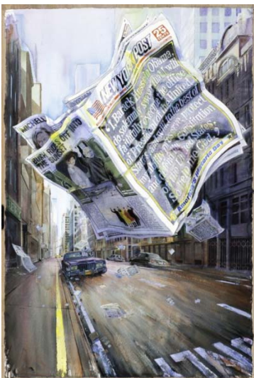
I, Barack... do solemnly swear , 2012, gouache sur papier, 154 x 103 cm