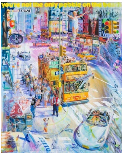
You're not the only pebble on the beach , 2012, huile sur toile, 200 x 160 cm