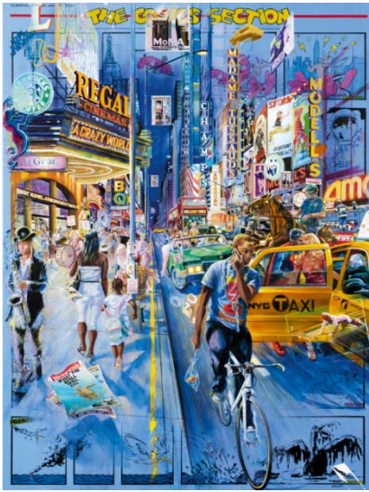
Red fish , 2012, huile sur toile, 130 x 97,5 cm