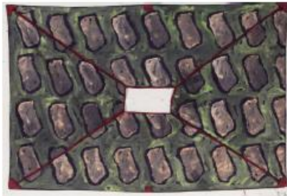
Sans titre, 2012, acrylique sur bâche, 194 x 300 cm