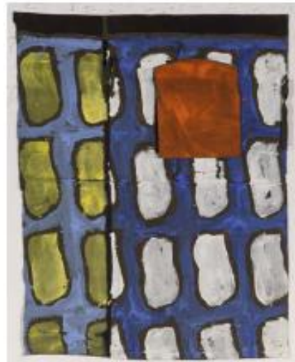
Sans titre, 2012, acrylique sur bâche militaire, 175 x 141 cm