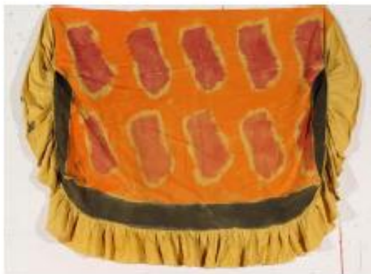
Sans titre, 2012, acrylique sur tissu d'ameublement, 145 x 210 cm