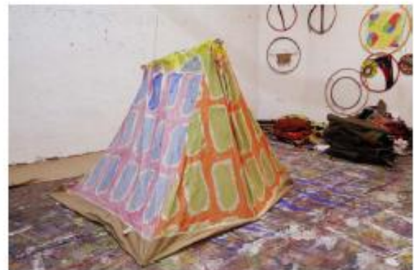
Sans titre, 2012, acrylique sur tente, 175 x 235 cm