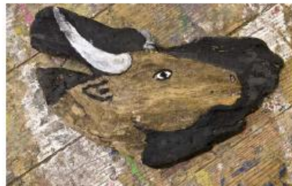
Sans titre, 2012, écorce de bois, 20 x 30 cm