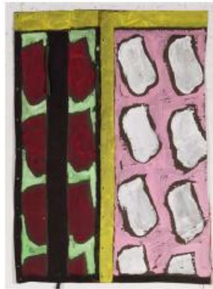
Sans titre, 2012, acrylique sur bâche militaire, 188 x 140 cm