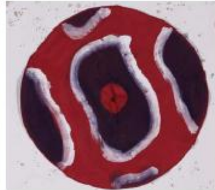
Sans titre, 2012, acrylique sur centre de parasol, d. 62 cm