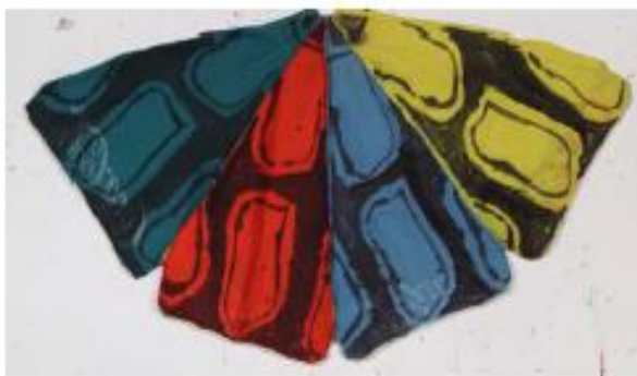
Sans titre, 2012, acrylique sur demi parasol Coca-Cola®, 105 x 205 cm