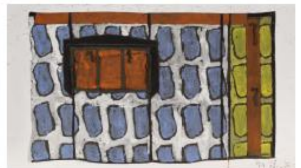
Sans titre, 2012, acrylique sur bâche militaire, 170 x 300 cm