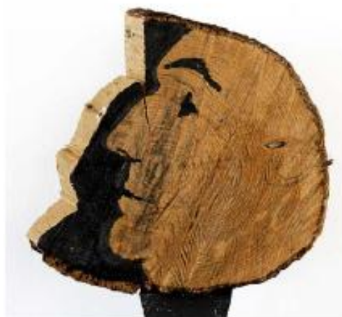
Sans titre, 2009, tronçon de bois, 18 x 16 cm