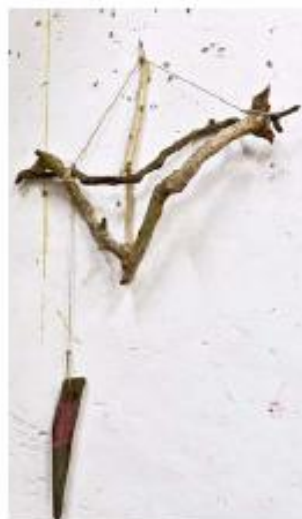
Sans titre, 2012, bois et ficelle, 110 x 75 cm