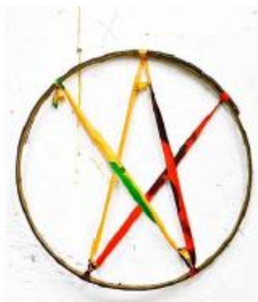
Sans titre, 2012, cerceau et rubans de couleur, d. 63 cm