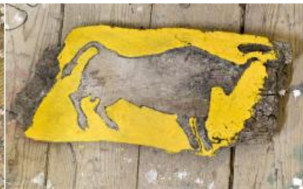
Sans titre, 2012, écorce de bois, 41 x 19 cm