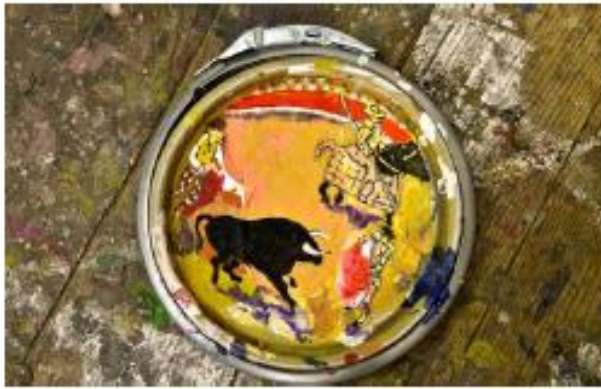
Sans titre, 2012, couvercle de pot de peinture, d. 19 cm