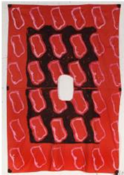
Sans titre, 2012, acrylique sur bâche militaire, 286 x 192 cm