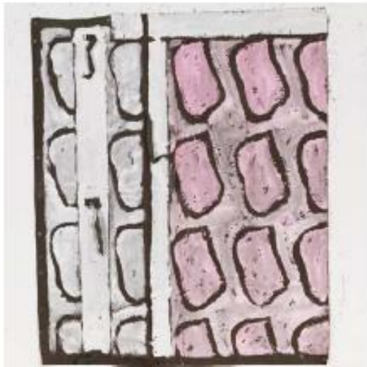
Sans titre, 2012, acrylique sur bâche militaire, 188 x 155 cm