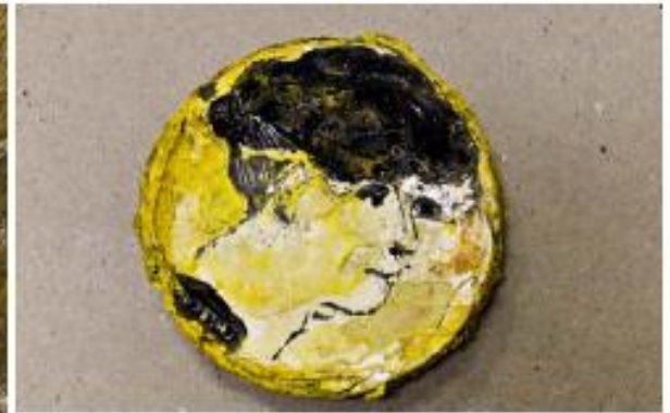
Sans titre, 2012, fond de peinture, d. 16,5 cm