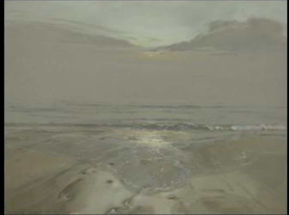
Philippe Garel, Reflux , 2009