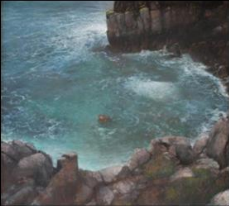
Jean-Pierre Le Bozec, Ouessant, l'attrait de l'abîme , 2011