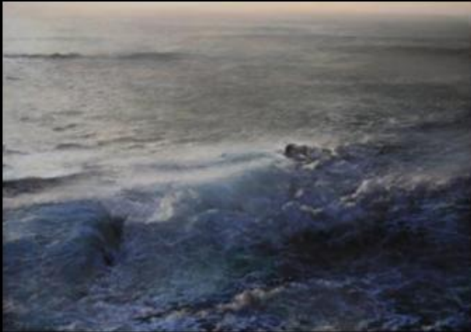
Jean-Pierre Le Bozec, Belle-Île, Gros temps , 2012